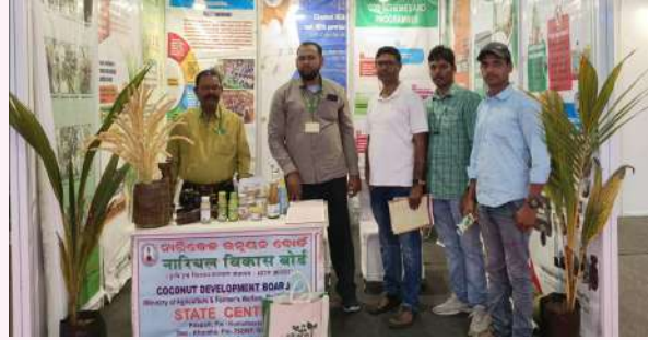
बोर्ड का स्टाल

कृषि एवं किसान कल्याण विभाग, ओड़िशा सरकार ने एफआईसीसीआई के सहयोग से जनता मैदान, भुवनेश्वर में 12 से 14 जनवरी 2024 तक 'कृषि में महिलाओं का जश्न मनाना' विषय पर राज्य स्तरीय कृषि प्रदर्शनी कृषि ओड़िशा 2024 आयोजित की। कृषि ओड़िशा 2024 ने महिला किसानों, स्वयं-सहायता समूहों, महिला कृषि-उद्यमियों, बाज़ार खिलाड़ियों और सेवा प्रदाताओं के बीच संवाद और सहयोग के लिए मंच प्रदान किया। कार्यक्रम के सिलसिले में प्रदर्शनी, निवेशक बैठक, किसान-वैज्ञानिक संवाद, किसानों का अभिनंदन, विस्तार कार्यकर्ता सम्मेलन और सांस्कृतिक कार्यक्रम आदि आयोजित किए गए।