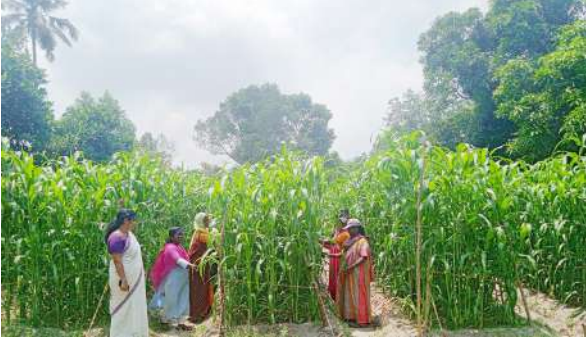
मिलेट की खेती

की खेती की गई थी। फसल की कटाई जून महीने के पहले सप्ताह और तीसरे सप्ताह के दौरान की गई। ज्वार (किस्म 35-1) एफएफपी के कई पंचायतों में उगाया जा रहा है। ओणाट्टुकरा की रेतीली मिट्टी में ज्वार का निष्पादन अच्छा रहा। यह फरवरी और अप्रैल 2023 के सबसे गर्म महीनों में पल्लवित हुआ। इसे एक सफल पहल के रूप में प्रदर्शित किया गया।