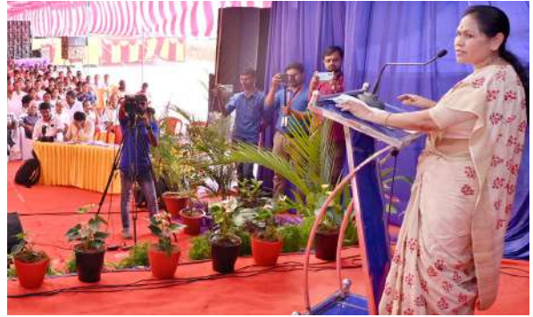
सुश्री शोभा करंदलाजे, माननीय केंद्रीय कृषि एवं किसान कल्याण राज्य मंत्री मुख्य अतिथि का भाषण देती हुई