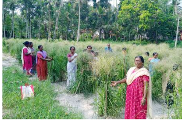
नारियल के साथ कुटकी की खेती

मिलेट 300-400 मि.मी. बारिश मिलने वाले शुष्क क्षेत्रों में भी अच्छी तरह बढ़ता है। यह शून्य कार्बन और कम ऊर्जा फुटप्रिंट के लिए जाना जाता है क्योंकि यह प्रति किलोग्राम उत्पादन के लिए जितना कार्बन उत्सर्जित करता है उसके बराबर कार्बन पर्यावरण से अवशोषित भी करता है। इसका उत्पादन कम पानी और कम बिजली की खपत से हो सकता है, अतः यह ऊर्जा कुशल भी है। सीमांत किसानों के लिए यह एक सुरक्षित और भविष्य की फसल है।