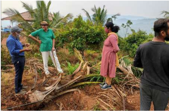
वैज्ञानिक लाल ताड़ घुन के प्रकोप से गिरे ताड़ का निरीक्षण करते हुए

गया ताकि कटा सिरा और शिखर के बीच अधिक दूरी बनी रहे। वर्ष 2021 के दौरान, तीन ताड़ धड़ क्षेत्र के ज़रिए लाल ताड़ घुन के शिकार हुए और तने पर प्रति लीटर 1 मि.ली. की दर पर इमिडाक्लोप्रिड का टीका लगाकर इन्हें कीट मुक्त किया गया। रोकथाम के उपाय के रूप में दो महीनों के अंतराल में विकर्षियों से पर्ण कक्षों को भरा गया और रोकथाम उपाय के रूप में इमिडाक्लोप्रिड एवं क्लोरपाइरिफोस का प्रयोग नहीं किया गया। 2022 में, शिखर से कीट का प्रवेश 0.002 प्रतिशत (1 ताड़) तक और धड़ क्षेत्र से कीट का प्रवेश 0.006 प्रतिशत (3 ताड़) तक कम हुआ और प्रकोपित ताड़ों के ठीक होने की प्रतिशतता 100 प्रतिशत तक बढ़ गयी।