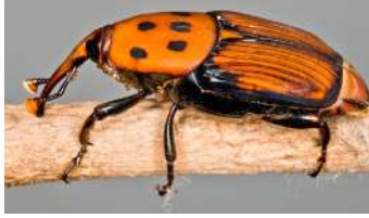
लाल ताड़ घुन

गैंडा भृंग का प्रकोप कम होने के फलस्वरूप घातक कीट लाल ताड़ घुन के प्रकोप की संभावनाएं भी कम हो जाती हैं, क्योंकि इस कीट