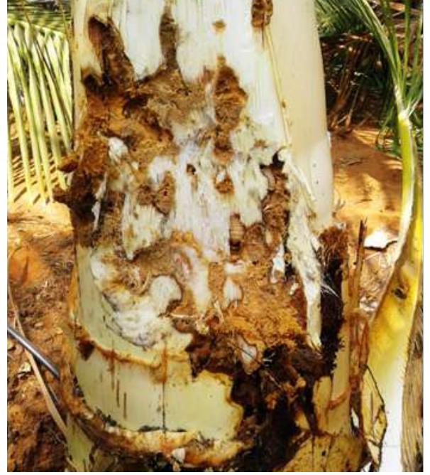
शिखर पर लाल ताड़ घुन से प्रकोपित नारियल पौध

2019 के मध्य से उनके बाग के फलदायी ताड़ लाल ताड़ घुन के घातक प्रकोप का शिकार बनने लगे। जब इसको ध्यान में लाया गया तो भा.कृ.अनु.प.-केंद्रीय रोपण फसल अनुसंधान संस्थान के वैज्ञानिकों की एक टीम ने बाग का दौरा किया और नियंत्रणोपाय सुझाए। लगभग 35 ताड़ों (64 प्रतिशत) पर लाल ताड़ घुन का प्रकोप शिखर क्षेत्र से हुआ था। कीट प्रकोप की पहचान होने और शिखर पर कीटनाशक डालकर निवारणात्मक उपाय अपनाए जाने तक शिखर गिरकर 29 ताड़ों की मृत्यु हुई और 6 ताड़ प्रकोप से मुक्त हुए। उन ताड़ों को प्रकोप से मुक्त करने के लिए 30 दिनों के अंतराल में प्रति लीटर 1 मि.ली. की दर पर इमिडाक्लोप्रिड 17.8 एसएल का प्रयोग शिखर के ज़रिए दो बार किया गया। सारे शिखर गिरे और मृत ताड़ों को जलाकर राख कर दिया गया ताकि बाग में लाल ताड़ घुन के प्रजनन को रोका जा सके। उसके साथ साथ, स्वस्थ ताड़ों को लाल ताड़ घुन के प्रकोप से बचाने के लिए रोकथाम के उपाय भी