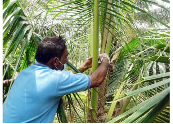
पर्ण कक्षों की भराई

ताड़ घुन पर नियंत्रण पाने के लिए अनुशंसित एकीकृत कीट प्रबंधन विधियों की प्रभावोत्पादकता और व्यवहार्यता पर यकीन करने लगे।