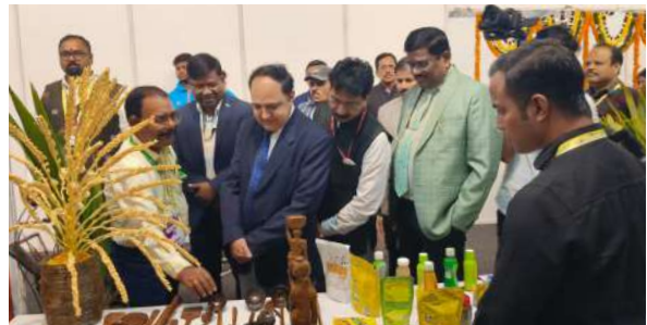
बोर्ड के स्टाल में आगंतुक

नारियल विकास बोर्ड, राज्य केंद्र, ओड़िशा ने आईसीएआर-एनआरआरआई, कट्टक में 19 से 21 जनवरी 2024 तक संपन्न एग्रि विशन प्रदर्शनी में भाग लिया। बोर्ड ने अपनी योजनाओं और नारियल के गुणों पर विभिन्न सूचनात्मक पोस्टर और बोर्ड के प्रकाशन प्रदर्शित किए। नाविबो के स्टाल में विर्जिन नारियल तेल, नारियल चिप्स, नीरा, डाब पानी, नारियल तेल और हस्तशिल्प जैसे विभिन्न मूल्य वर्धित उत्पादों प्रदर्शित किए गए।