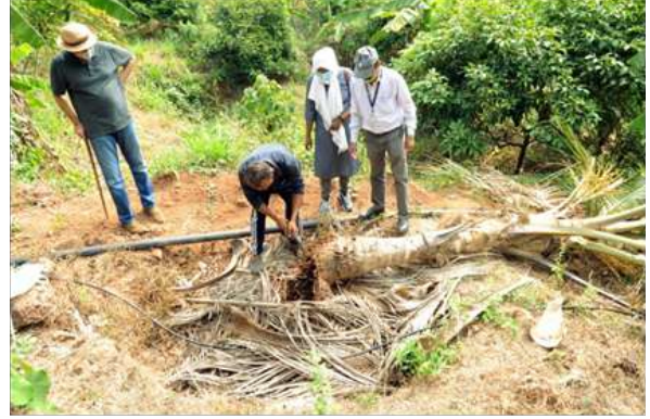
धड़ पर लाल ताड़ घुन के प्रकोप का निरीक्षण

की पहचान और निवारणात्मक उपाय के रूप में तने पर प्रति लीटर 1 मि.ली. की दर पर इमिडाक्लोप्रिड का टीका लगाने से ताड़ों को बचाया जा सका। 87 प्रतिशत याने 55 ताड़ कीट प्रकोप से मुक्त हुए। गंभीर रूप से कीट प्रकोपित 8 ताड़ मर गए। स्वस्थ ताड़ों के धड़ क्षेत्र से लाल ताड़ घुन का प्रवेश रोकने के लिए एक बार रोकथाम उपाय के रूप में प्रति लीटर 5 मि.ली. की दर पर क्लोरपाइरिफोस से थालों को शराबोर किया गया और गर्दनी भाग और तने के मूल भाग को भिगोने का सुझाव दिया गया। पहले चर्चा किए गए अनुसार रोकथाम के रूप में पर्ण कक्ष उपचार को जारी रखा गया, लेकिन उपचार के बीच का अंतराल 30 दिनों के बजाय बढ़ाकर 45 दिन कराया गया। कीट की आबादी कम करने के लिए सारे मृत ताड़ों को जलाया गया। पत्तों को काटते समय विशेष रूप से यह ध्यान रखा गया कि ताड़ पर घाव न लगे, इसलिए तने से 1.2 मीटर लंबाई में पर्णवृंत को छोड़कर पत्तों को काटा