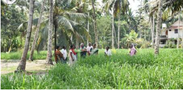
देवीकुलंगरा पंचायत में कुटकी की खेती

पोषण महत्व: 100 ग्राम कुटकी में 314 किलो कैलोरी ऊर्जा, 65.55 ग्राम कार्बोहाइड्रेट, साथ ही 10.13 ग्राम प्रोटीन, 7.72 मिलीग्राम कच्चा रेशा, 32 मिलीग्राम कैल्शियम और 1.3 मिलीग्राम आयरन निहित होते हैं।