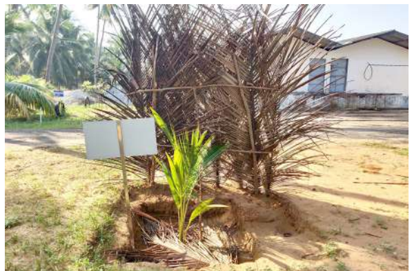
छाया प्रदान करना

नवरोपित नारियल पौधों को यदि पहले छाया प्रदान नहीं की गई हो तो अब छाया प्रदान करें।