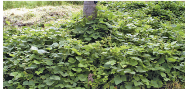
छादन फसल से थाला प्रबंधन

हरी खाद दलहनी फसलों जैसे कि प्यूररिया फेसोलोइड्स , केलापगोनियम मुकुनोइड्स , लोबिया ( विग्ना अंगुइकुलेटा ), सनई ( क्रोटेलेरिया जंकिया ), कुलथी ( मैक्रोटाइलोमा यूनिफ्लोरम ), ढेंचा ( सेसबानिया एक्वुलेटा ) और सेसबानिया स्पिनोसा की खेती नारियल थालों में की जा सकती है और 50 प्रतिशत पौधों पर फूल लगने पर इन्हें हरी खाद के रूप में मिट्टी में मिलाया जा सकता है। जून महीने के दौरान पेड़ के थाले में 1.8 मीटर के घेरे में प्रति थाला 100 ग्राम की दर पर इन फसलों के बीज बोए जा सकते हैं।