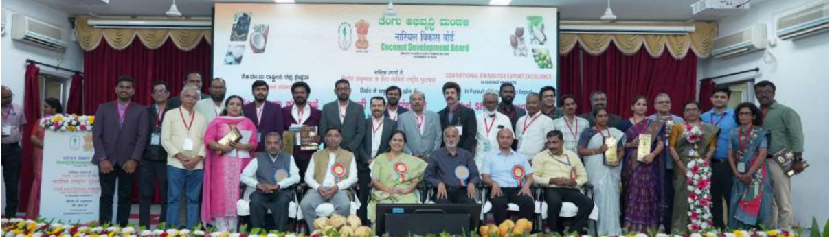
सुश्री शोभा करंदलाजे, कृषि एवं किसान कल्याण राज्य मंत्री, भारत सरकार पुरस्कार वितरण समारोह के दौरान पुरस्कार विजेताओं और अन्य गणमान्य व्यक्तियों के साथ

किसानों की आय दोगुनी करने के भारत सरकार के दृष्टिकोण को हासिल करने के लिए हमें नारियल उत्पादों के विविधीकरण पर अधिक ध्यान केंद्रित करने की ज़रूरत है, सुश्री शोभा करंदलाजे, कृषि एवं किसान कल्याण राज्य मंत्री, कृषि एवं किसान कल्याण मंत्रालय, भारत सरकार ने कहा। मंत्री 29 फरवरी 2024 को एनआईएनपी ऑडिटोरियम, बैंगलूरु में नारियल विकास बोर्ड के निर्यात उत्कृष्टता के लिए राष्ट्रीय पुरस्कारों की घोषणा एवं वितरण कर रही थी।