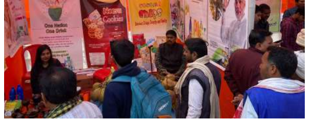
बोर्ड का स्टाल

नारियल विकास बोर्ड, क्षेत्रीय कार्यालय, पटना ने कृषि विज्ञान केंद्र, पिपराकोठी, पूर्व चंपारण में 10 से 12 फरवरी 2024 तक आयोजित किसान कल्याण मेला 2024 में भाग लिया। बोर्ड ने विभिन्न मूल्य वर्धित उत्पादों जैसे कि विर्जिन नारियल तेल, नीरा, नारियल चिप्स, नारियल तेल, नारियल दूध पाउडर, नारियल आधारित हस्तशिल्प वस्तुएं और विभिन्न किस्मों के नारियल गुच्छे प्रदर्शित किए। बोर्ड के स्टॉल में नारियल खेती और नारियल खाद्य उत्पादों पर सूचनापरक चार्ट, बोर्ड द्वारा प्रकाशित पुस्तिकाएं और पत्रिकाएं भी प्रदर्शित किए गए।