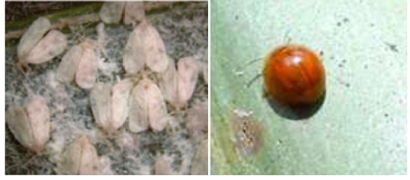
रूगोस स्पाइरलिंग सफेद मक्खी