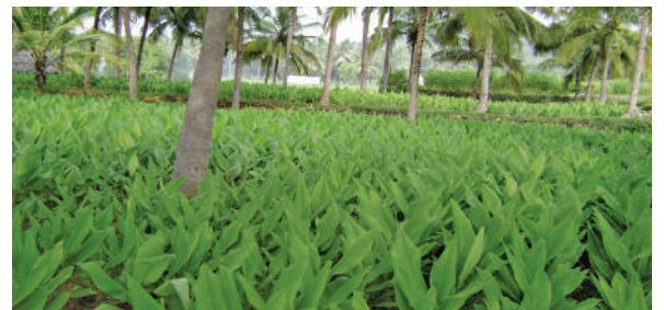
नारियल बाग में हल्दी की अंतर खेती

जून महीने में नारियल बाग में उपयुक्त अंतर/मिश्रित फसलों का रोपण किया जा सकता है। केला, अनन्नास, अदरक, हल्दी, कसावा, शकरकंद जैसी अंतरफसलों और कालीमिर्च, जायफल, लौंग, दालचीनी, वैनिला, कोको आदि बहुवर्षी फसलों का भी रोपण किया जा सकता है।