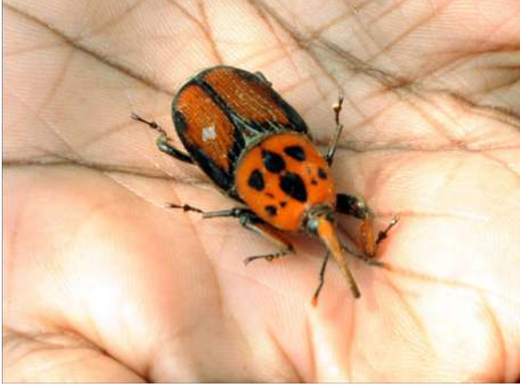
लाल ताड़ घुन