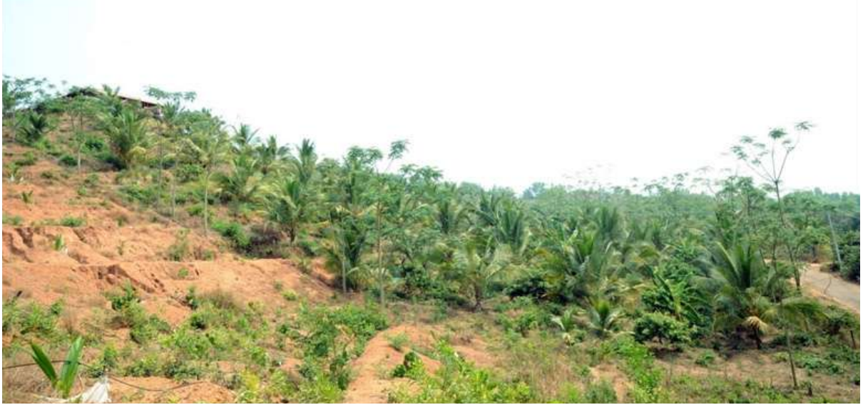
बायार का नारियल बाग