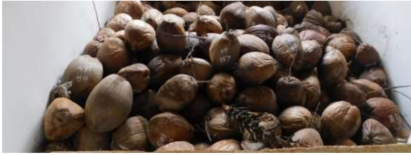
बीजफलों का भंडारण

चयनित मातृ ताड़ों से बीजफलों की तुड़ाई करना जारी रखें। बीजफलों की तुड़ाई सावधानी से की जानी चाहिए और जहाँ भी ज़मीन ठोस हो, फलों की तुड़ाई करके रस्सी के सहारे नीचे लाना चाहिए। फल के अंदर का पानी सूख न जाए, इसके लिए समुचित रूप से भंडारण करना चाहिए।