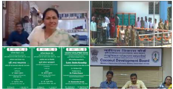
कार्यालय भवन के उद्घाटन समारोह की झलक

कृषि एवं किसान कल्याण राज्य मंत्री सुश्री शोभा करंदलाजे ने 13 मार्च 2024 को प्रबीउ फार्म, अभयपुरी, असम में नारियल विकास बोर्ड के नए कार्यालय भवन का वर्चुअल तरीके से उद्घाटन किया। मंत्री ने भारत के उत्तर पूर्वी राज्यों में नारियल खेती में सुधार के लिए समर्पित प्रयासों के लिए नारियल विकास बोर्ड की सराहना की। उन्होंने उत्तर भारत के लोगों को खाद्य और गैर-खाद्य दोनों उद्देश्यों के लिए नारियल तेल का इस्तेमाल करने के लिए प्रोत्साहित किया और इसके कई लाभों पर ज़ोर दिया।