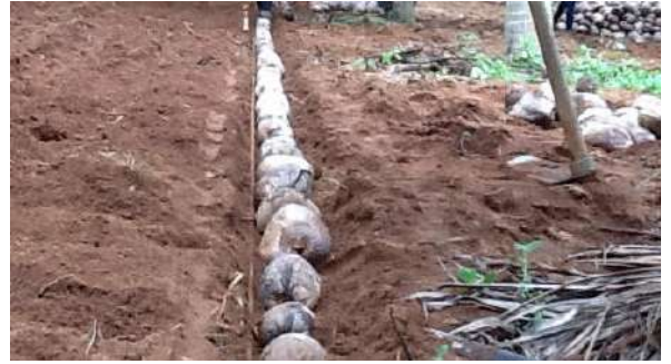
बीजफलों की बुआई

अच्छी तरह जलनिकास युक्त, दानेदार मिट्टी में नर्सरी पालनी चाहिए और यह ऐसे स्थान पर हो कि उसके निकट सिंचाई के लिए पर्याप्त मात्रा में पानी उपलब्ध हो। यदि जल निकासी की कोई समस्या नहीं हो तो बीजफल सपाट क्यारियों में बोए जा सकते हैं। यदि पानी जमा होने की समस्या हो तो ज़मीन पर टीले बनाकर ऊँची क्यारियों में बीजफलों का रोपण करना चाहिए। नर्सरी खुले क्षेत्र में कृत्रिम रूप से छाया देकर या बागों में ऊँचे ताड़ों के नीचे जहाँ भागिक रूप से छाया उपलब्ध हो, पाली जा सकती है। बीजफलों की बुआई लंबी और संकरी क्यारियों में 40 से.मी. X 30 से.मी. की दूरी में खड़ी स्थिति में या पड़ी स्थिति में 20-25 सें.मी. गहरी खाइयों में की जा सकती है। बीजफलों का खड़ी स्थिति में रोपण करने का फायदा यह है कि नारियल पौधों को दूसरी जगह ले जाते समय नुकसान कम होता है। किंतु यदि रोपण देरी से कर रहा हो और फल के अंदर का पानी अत्यधिक कम हो जाता हो तो, पड़ी स्थिति में बुआई करना उचित होता है। बेहतर