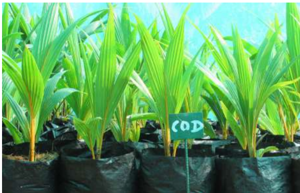
चावक्काट नारंगी बौनी किस्म के पोलीबैग पौधे

विकल्प के रूप में पोर्टिंग मिश्रण भरने के लिए पटसन के बैगों/बोरियों का उपयोग किया जा सकता है क्योंकि इसमें जैवनिम्नीकरण गुण है।