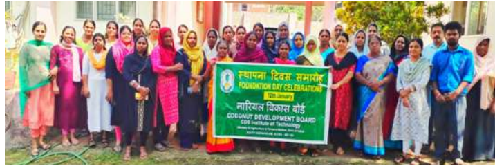
जागरूकता सह प्रशिक्षण कार्यक्रम के सहभागी

नाविबो प्रौद्योगिकी संस्था ने नाविबो के स्थापना दिवस के सिलसिले में किसानों/उद्यमियों/महिला स्वयं सहायता समूहों के लिए नारियल में मूल्य वर्धन पर जागरूकता सह प्रशिक्षण कार्यक्रम आयोजित किया। कार्यक्रम में दक्षिण वाष्वकुलम ग्राम पंचायत के तहत विभिन्न वाडों से 25 प्रतिभागियों ने भाग लिया। कार्यक्रम में जागरूकता सत्र के अलावा तीन नारियल उत्पादों का निदर्शन भी शामिल था।