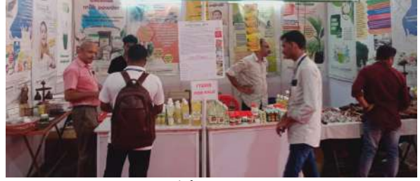
बोर्ड का स्टाल