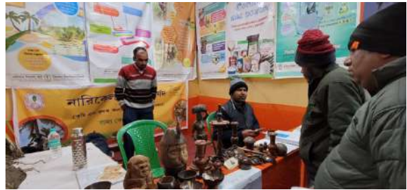
बोर्ड का स्टाल

नारियल विकास बोर्ड, राज्य केंद्र, पश्चिम बंगाल ने 18 से 21 जनवरी 2024 तक नरेंद्रपुर रामकृष्ण मिशन आश्रम, दक्षिण परगना जिला में संपन्न 55वें श्री रामकृष्ण मेला और प्रदर्शनी में भाग लिया। बोर्ड ने अपनी योजनाओं और नारियल के गुणों पर विभिन्न सूचनात्मक पोस्टर और बोर्ड के प्रकाशन प्रदर्शित किए। बोर्ड ने अपने स्टाल में विभिन्न मूल्य वर्धित उत्पादों जैसे विर्जिन नारियल तेल, डाब, नारियल तेल, हस्तशिल्प वस्तुएं, विभिन्न नारियल पौधे आदि प्रदर्शित किए।