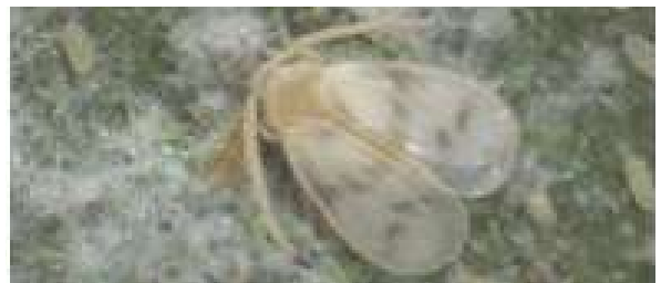
नेस्टिंग सफेद मक्खी