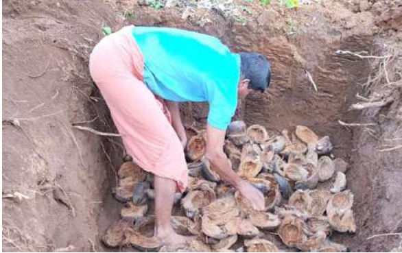
रोपण के लिए गड्ढे की तैयारी

500 ग्राम नत्रजन, 320 ग्राम फोस्फरस और 1200 ग्राम पोटेशियम की सिफारिश की जाती है। पौष्टिकतत्वों के एक तिहाई हिस्से का प्रयोग करने के लिए 0.36 कि.ग्रा. यूरिया, 0.5 कि.ग्रा. रोक फोस्फेट (अम्लीय मिट्टी में) या 0.7 कि.ग्रा.सूपर फोस्फेट (अन्य प्रकार की मिट्टियों में) और 0.7 कि.ग्रा. म्यूरिएट ऑफ पोटेश का प्रयोग करना अनिवार्य होता है। गर्मी की फुहारों की प्राप्ति पर नारियल पेड़ के थाले में 1.8 मीटर के घेरे में उर्वरकों की अनुशंसित मात्रा के एक तिहाई हिस्से का प्रयोग करना चाहिए और अच्छी तरह मिट्टी में मिला देनी चाहिए। यह उचित होता है कि तीन साल में एक बार नारियल बाग की मिट्टी की जाँच सावधिक रूप से करें और इसके परिणामों के आधार पर किस प्रकार के रासायनिक उर्वरकों का प्रयोग किया जाना चाहिए और कितनी मात्रा में देनी चाहिए इस पर निर्णय लिया जा सकता है।