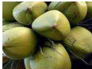
പച്ച തേങ്ങ കയറ്റുമതി