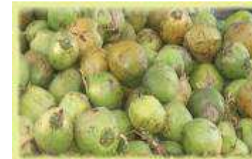
നാളികേര സംഭരണവും വിപണനവും