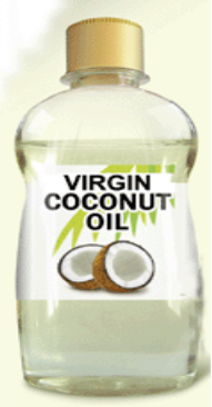
വെർജിൻ കോക്കനട്ട് ഓയിൽ