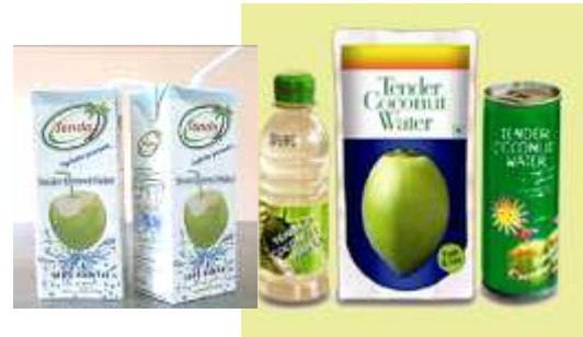
കരിക്കിൻ വെള്ളം പായ്ക്ക് ചെയ്യുന്ന യൂണിറ്റ്