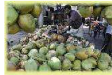
കരിക്ക് ശേഖരണവും വിപണനവും