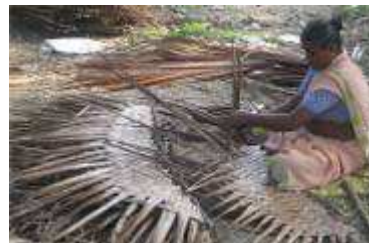
ഇഴുർക്കിലും കാലയും വാണിജ്യോപയോഗത്തിന്